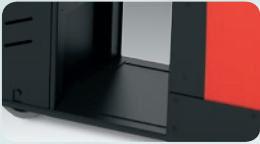
Lågt insteg och vibrationsdämpad golvyta.