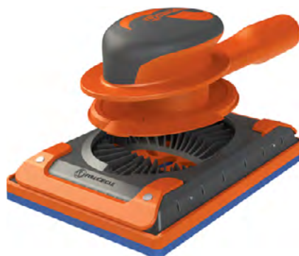
Pole adaptor handle